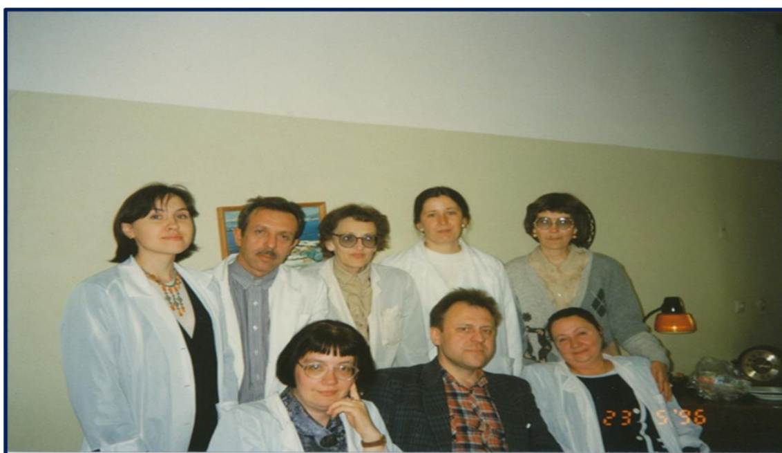
Рис.6 Отдел медицинской психологии (ФГБНУ НЦПЗ)