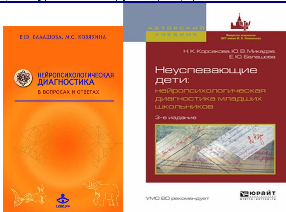
Рис.8. Научные труды Е.Ю. Балашовой

Елена Юрьевна имела много увлечений и интересов — это музыка, живопись, прикладное искусство, классическая литература, фотография, искусство стран Востока, ювелирное искусство. Она щедро делилась знаниями в этих областях с близкими и коллегами, увлекала своими рассказами и фотографиями после многочисленных путешествий, которые были ее особой страстью.