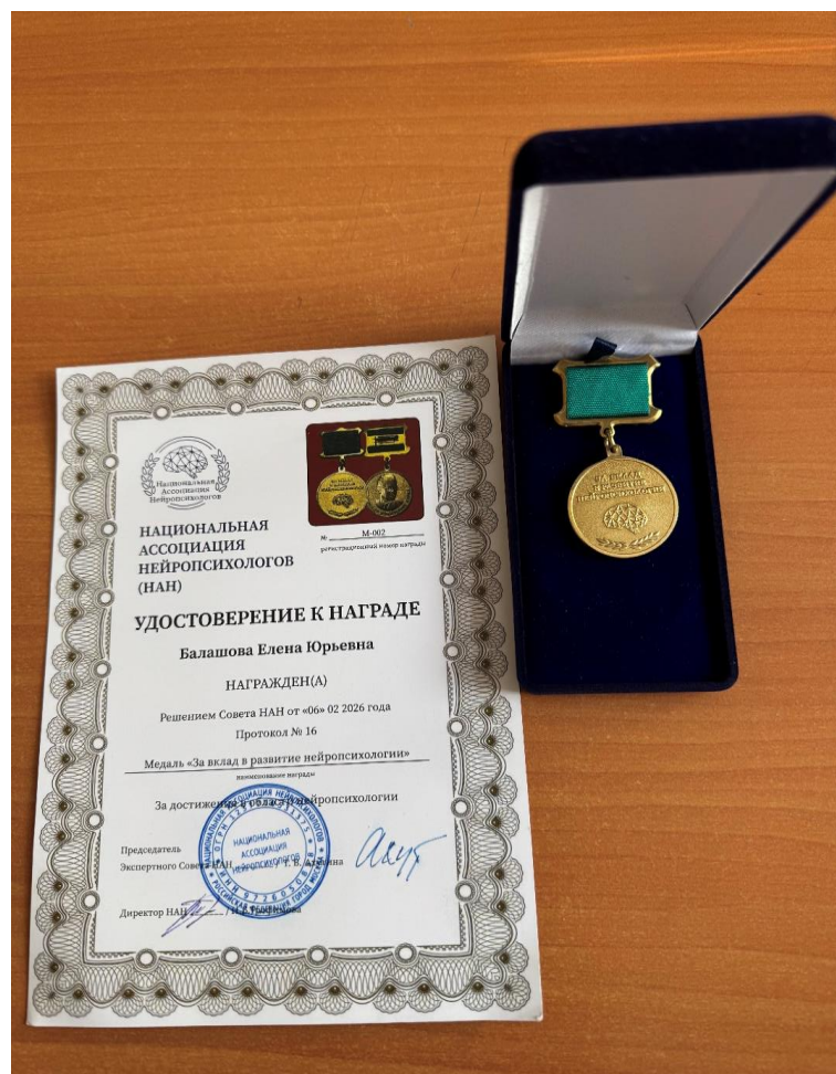
Рис. 13. Медаль «За вклад в развитие нейрпсихологии» (2026)