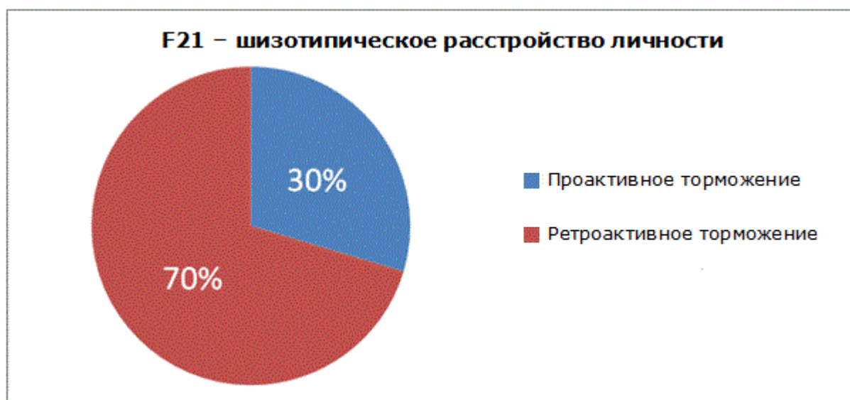
Рис. 2. Частота встречаемости проактивного и ретроактивного торможения следов слухоречевой памяти в группе больных детей и подростков с диагнозом F21 — шизотипическое расстройство личности.

Для больных с диагнозом F21 (шизотипическое расстройство личности) характерно наличие ретроактивного торможения следов (70% по группе). Это означает, что для данной группы больных возникает затруднение в запоминании материала под влиянием последующей деятельности (последующая информация оттормаживает предыдущую — см. Рис. 2).